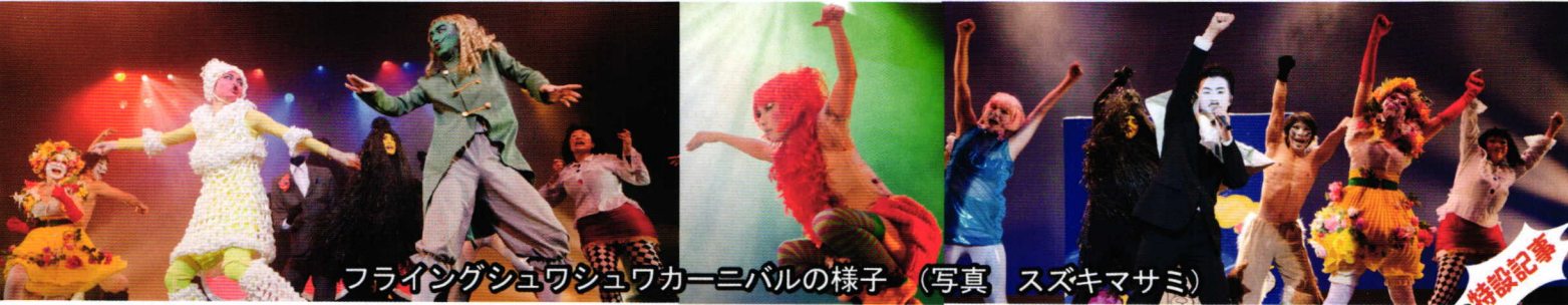
フライングシュワシュワカーニバルの様子