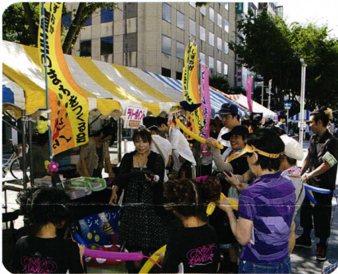
▲風船大道芸人によるワークショップではたくさんの人たちがバルーン体験をしました!

九月十一日(日)、晴天。「第三十二回ふくしのおまつり・しずおかふれあい広場」という催しが青葉公園でありました。その中に私達しるまのブースを出しました。実はその計画段階からは一切関わっていないが、私達でもおまつり自体どういうものなのだろう、しるまの会はどんなことをするのかしら、と興味本位で当日朝からブースをうろつき、いつのまにか終日ブースのお手伝いをさせてもらっていたのでした。