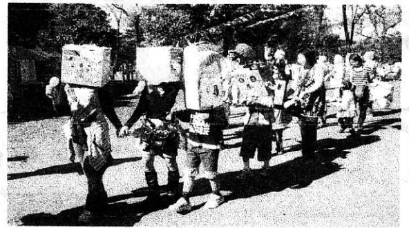
2008年11月 大道芸ワールドカップでの企画ペーパーロボット大行進

会合に参加してくださったという実働メンバーには現役大道芸人、大道芸人の卵、主婦、大学生、もちろんフルタイムで働いている方もいます。ほとんどの皆さんはふだん大道芸とは関係ない仕事をされたりして、一〇〇%ボランティアで構成されています。