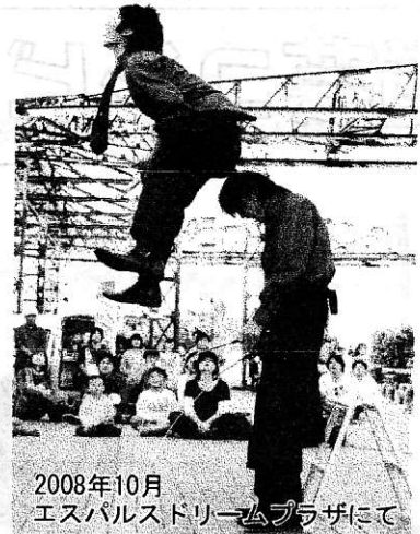
2008年10月 エスバルスドリームプラザにて

H「用意した技がきれいに決まったときとか、観てる方から拍手で応えてもらえたりするんですが、やっぱりそういうのが嬉しいですね」