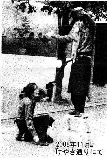
2008年11月 けやき通りにて

静岡にいる限り、週末の予定があいてる限り、これからはPrompterの大道芸は続く。二番手コンビから始まった二人のパフォーマンスは半年以上続いている活動の中です。静岡の街中大道芸の一角である。やき通りの「顔」となっている。これからの発展を遂げていくのか、たいへん楽しみである。