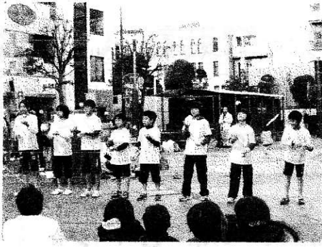
2008年12月 クリスマス大道芸

A 定期的にイベントも開催しています。夏やクリスマスに合同で大道芸をしたり、ネタや初披露の場といった感じですね。