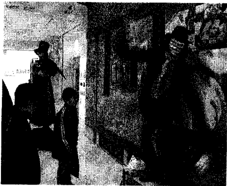
スタチューのダンスに興味津々！