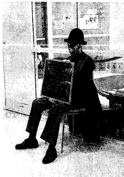
地元静岡から『ノッティー』

いつもと違うのは、パフォーマーがスタチューだけだということ。それも屋内の限られたスペースに、所狭しと6体も登場したのです。「スタチューミュージアム」と名づけられたこの試みは、「スタチューだけで、イベントは成立するのか？」という不安をあっという間に吹き飛ばしてしまうくらい大盛況でした。