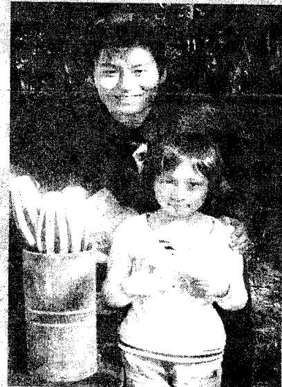
ももっちと美貴ちゃん

小さなももっちファンから3年配の方までの心をつかんだ、ももっちの魅力の一端を感じた1日だった。(文・写真 Japan)