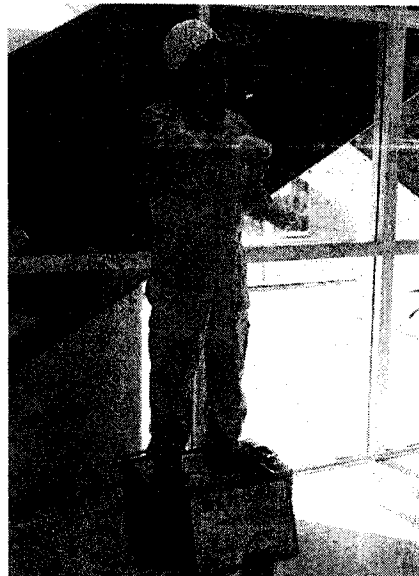
愛知県から登場 『李之介』

日本各地のイベントで「大道芸」をよく見かけるようになったけど、「スタチュー」しかないイベントは、「静岡でしかないんじゃないだろうか？」