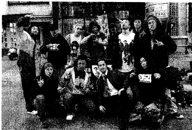
SHIZUOKA B-BOYZ メンバー 2008年2月11日撮影

http://www14.plala.or.jp/grand-gee-groovy/