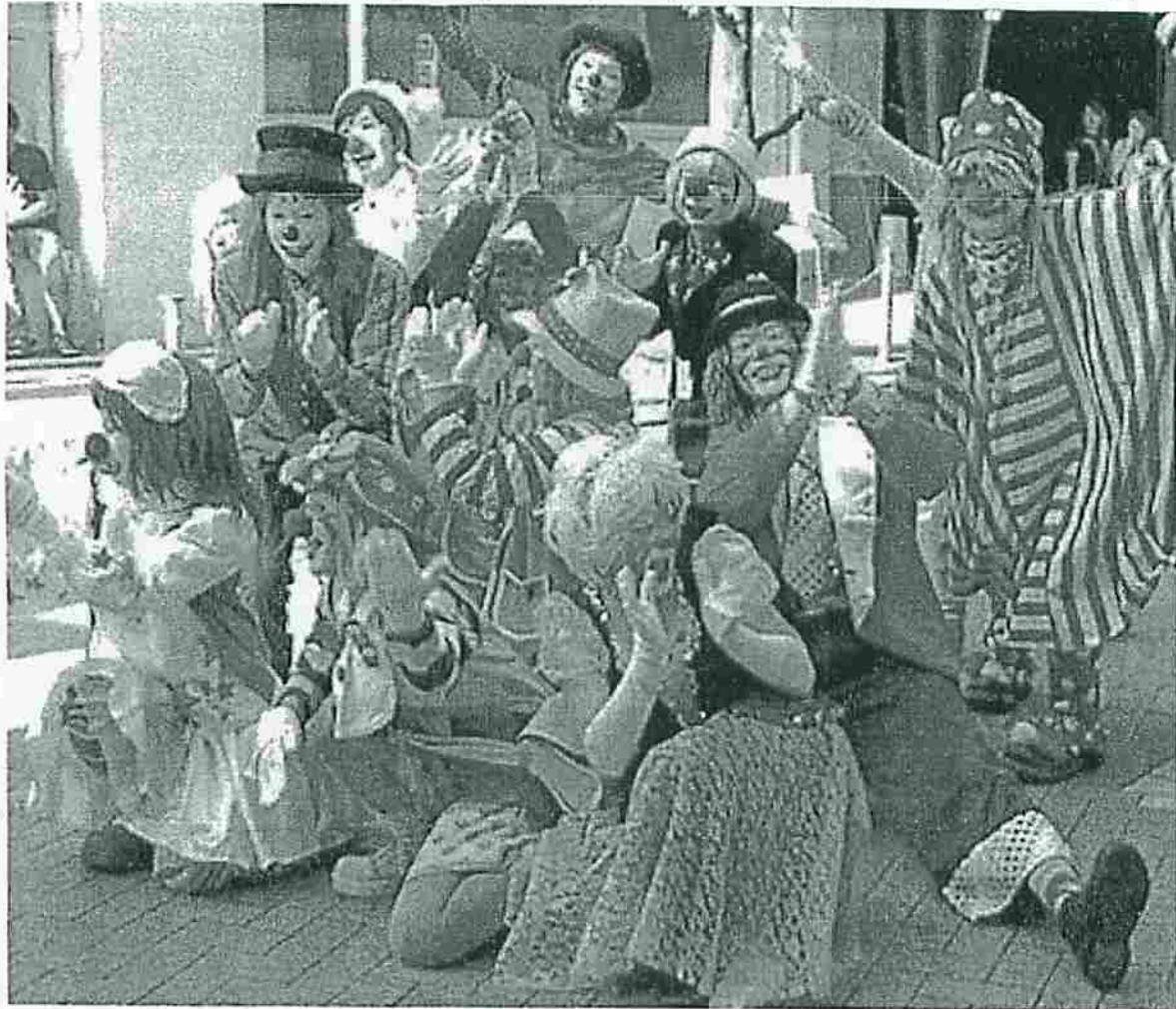
▲けやき通りでダンスを披露するクラウンたち (2006年9月23日、けやき通り)