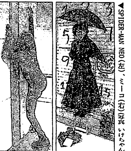
▶SPIDER-MAN NEO (左)、ミューコ(右)

6月25日(日)。紺屋町地下商店街が、一時特殊な空気に包まれた。見慣れたはずの町並みに4体の不思議な像が現れたからだ。なんだあれは？そんな思いの通行人がたくさんいたに違いない。「スタチューフェスタ」。それが今回のイベントの名称。スタチューとは彫像という意味で、彫像になりきるパフォーマー達。ただこのスタチュー達、急に動いては周りの人達を驚かせたりすることもある困ったちゃん達でもある。しかし、そんなスタチュー達に近づき写真を撮ったり、投げ銭をし握手をしてもらうなどの強者通行人が続出。いつしか遠巻きながら人だかりが出来ていた。スタチューだけのイベントなんて、今現在静岡しかないだろう。「不思議に満ちあふれる街、静岡」そう思われるのも時間の問題であらう。【ミューコ】