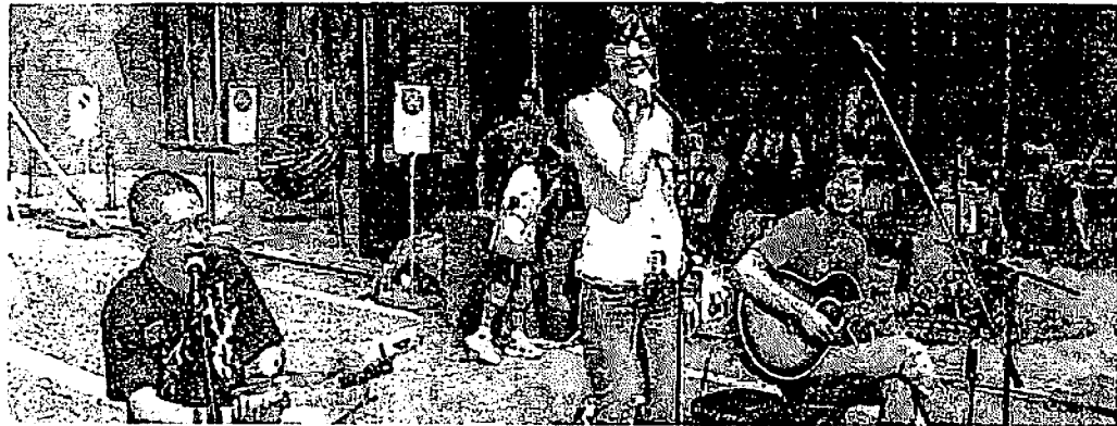
▶ストリートライブ

ージャンからストリートで頑張っているミュージシャンまで多くの人が登録している。その中でGnomeは、東海エリア1位・全国ランキング12位(8月14日現在)という位置にいる。このランキングはファン投票数で決まる。また、「広大な大地の上で」