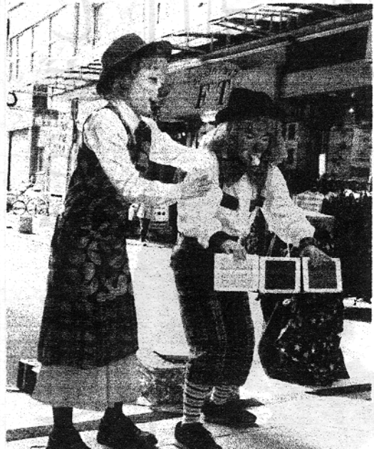
いよいよ見せ場の箱芸も2人にかかればドットンパタン(沼津市・仲見世商店街)

今後、にゃんこは得意なパルーンだけで構成された芸、思い出に残る、ほのぼのしたパフォーマンスを目指す。